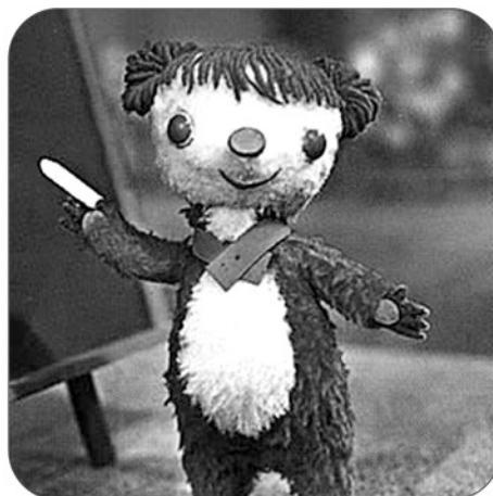
« Colargol » Un superbe souvenir d'enfant