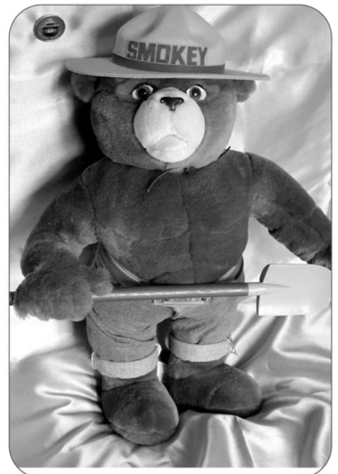
« Smokey » Le protecteur des forêts