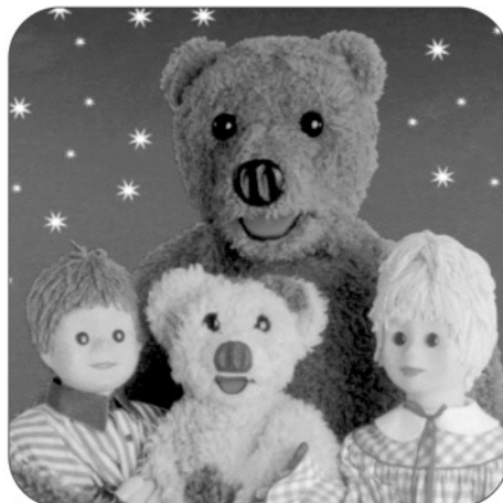
« Nounours avec Nicolas & Pimprenelle » ont bercé les nuits des petits...

Vous trouverez dans les pages suivantes les compte-rendus de différents salons en Europe.