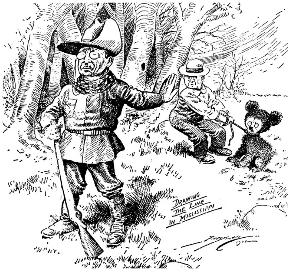
« Drawing the line in Mississippi » de Clifford Berryman

La même année en Allemagne, Margaret Steiff , une dame clouée sur une chaise roulante et âgée de 70 ans, était à la tête d'une petite entreprise de jouets en feutre. Son neveu lui proposa un projet d'ours en peluche à partir de croquis d'ours qu'il avait fait dans un zoo de Stuttgart.